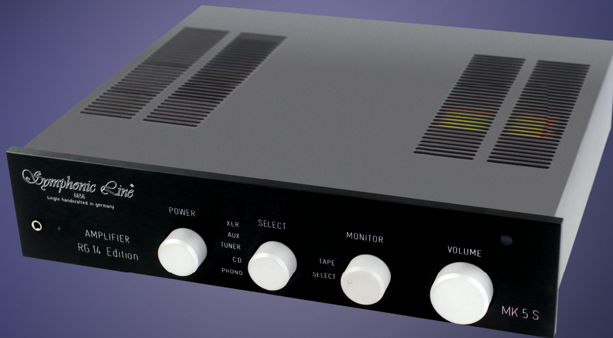
Symphonic Line RG14 Edition Mk5 S | Make My Day Records | Islay

Deutschland €11 | Österreich €12,30 | Luxemburg €13,00 | Schweiz sfr 15,50